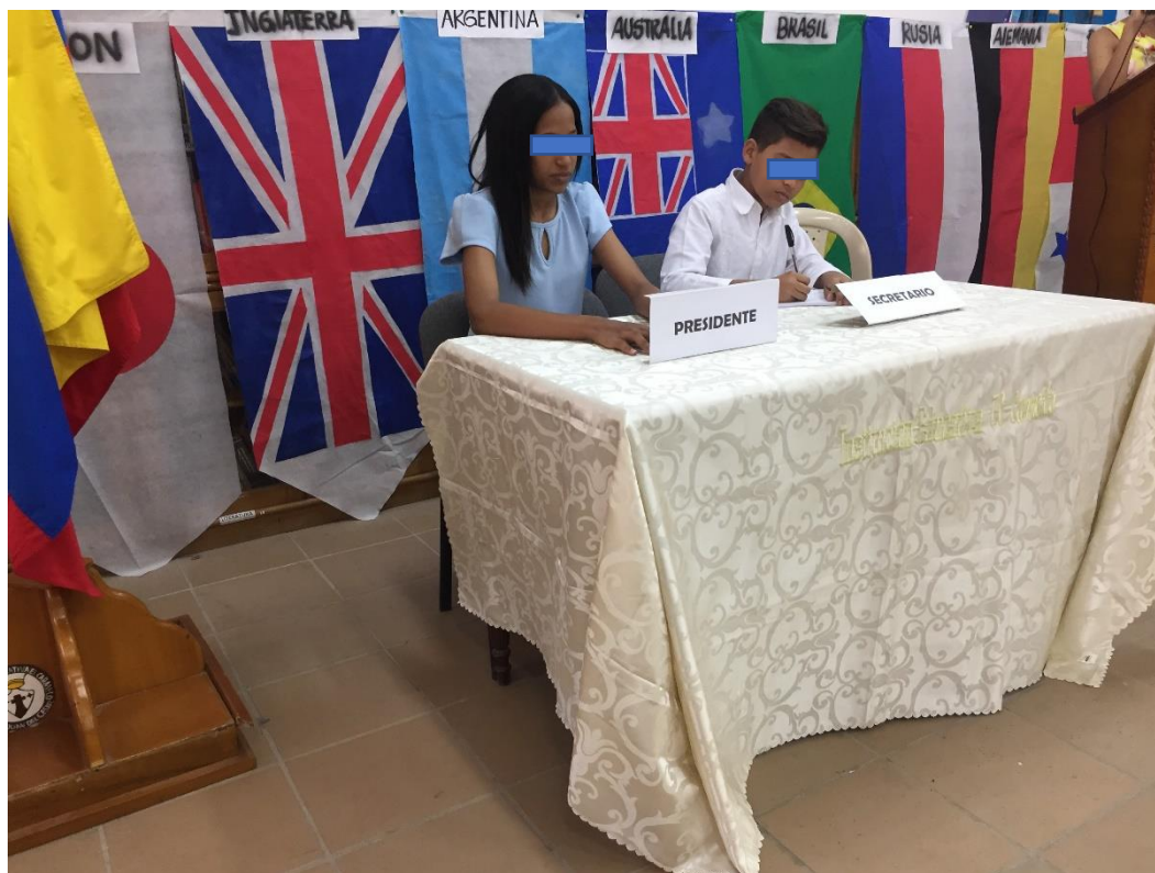
1. Presidente y secretario de Comisión