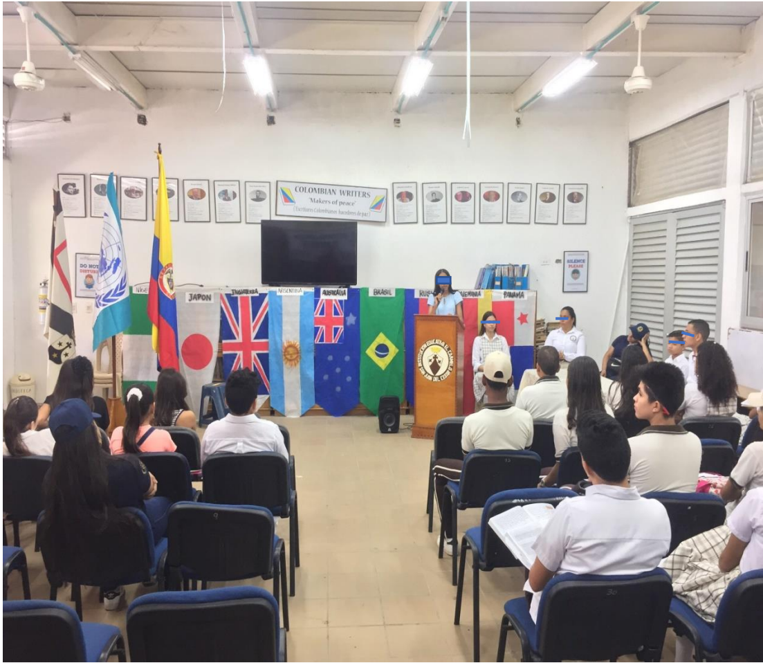
2. Apertura del evento modelo ONU 2018