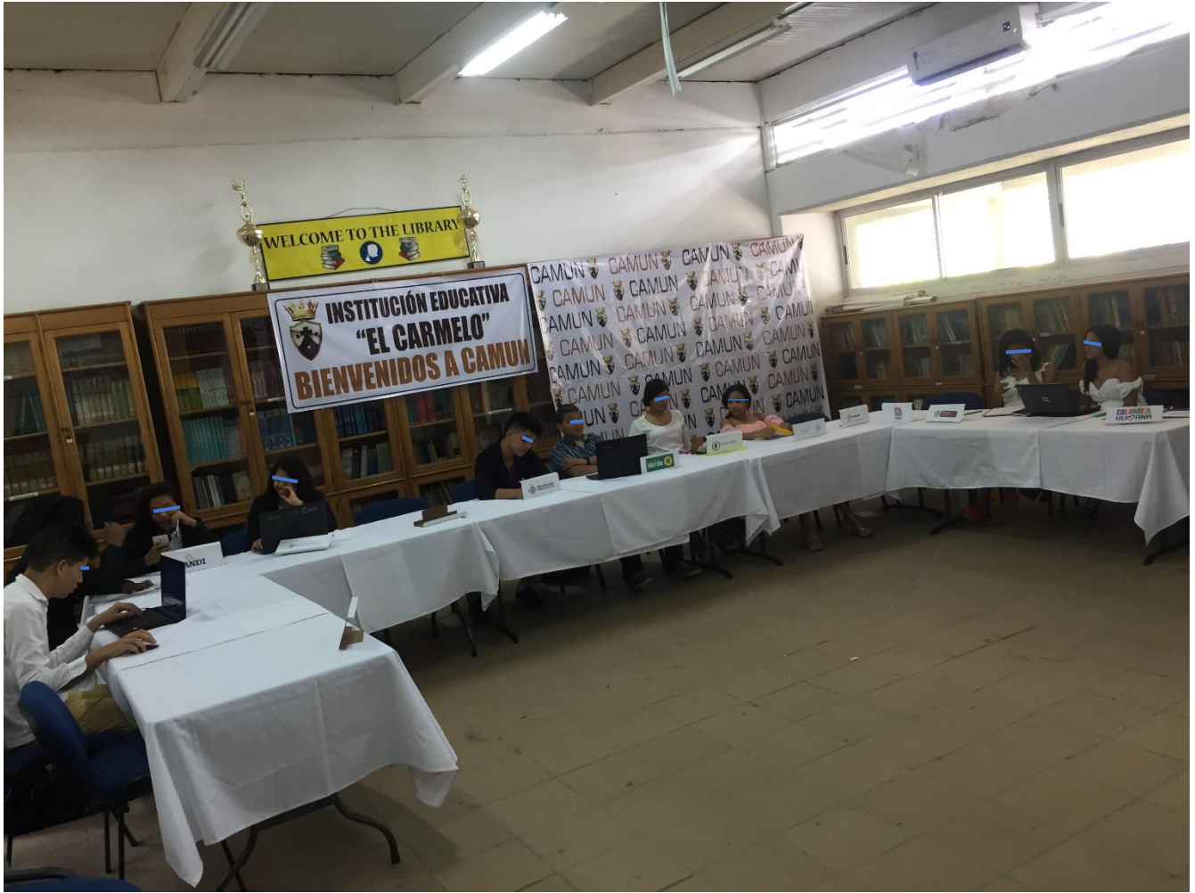
4 Organización de Debate