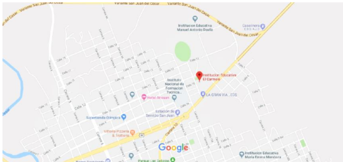
Figura 2. Ubicación: Institución Educativa El Carmelo.