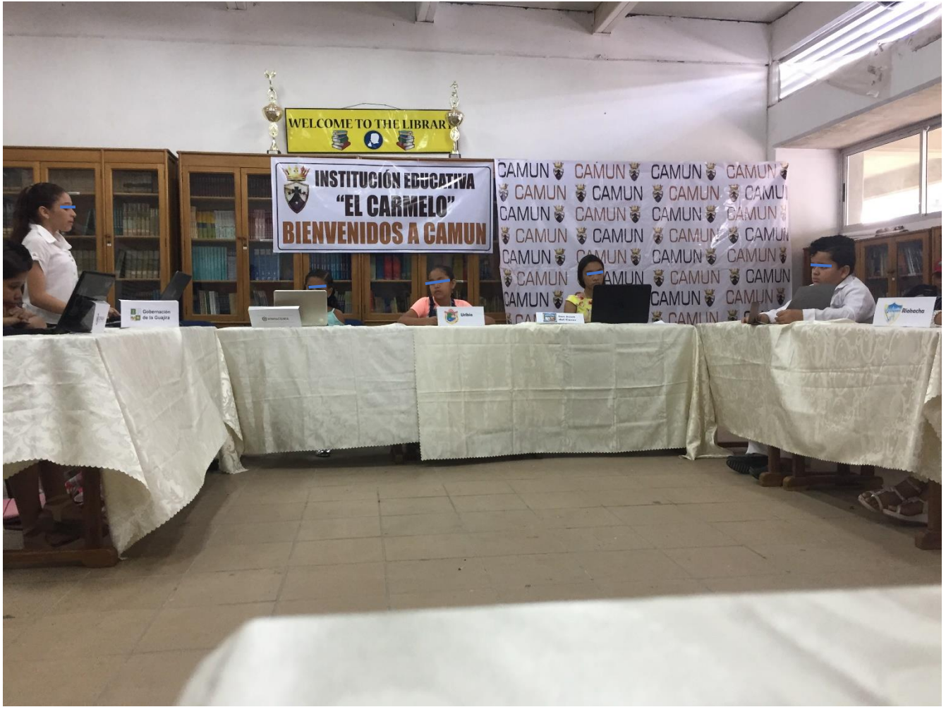
3 Debate informal