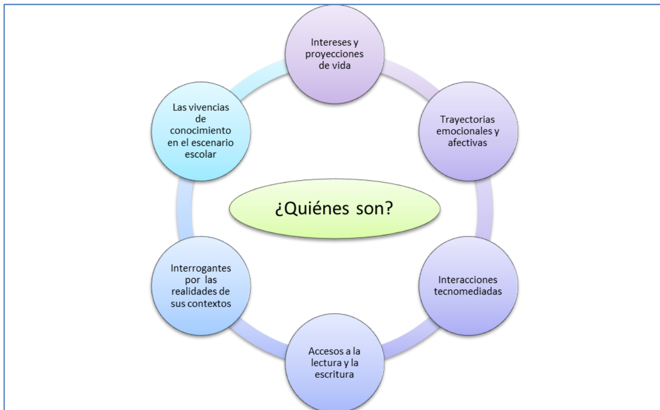
Ilustración 1. Reconocimiento de los estudiantes como sujetos